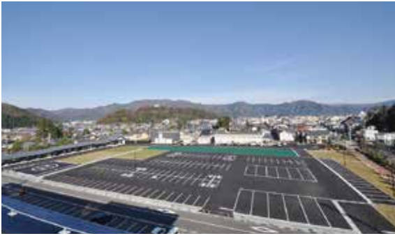
城下町南広場 Castle town south plaza 城下街南广场