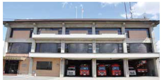
消防本部(消防署) Fire-Fighting Headquarters (Fire-Fighting Department) 消防总部(消防部门)