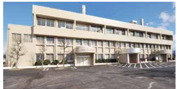
災害時医療拠点(休日急患診療所) Medical center at the time of disaster (holiday emergency clinic) 灾难医疗中心(假日急诊)