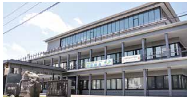
災害対策本部(市庁舎) Headquarters for emergency disaster control (City Hall) 灾害对策总部(市政厅)

在市区发生大规模的灾害时，必须马上做好和灾害，拼搏的应急对策准备。在那种情况下，立即联合有关机关在大野市政厅中设立防灾总部，收集情报，做出应急活动。