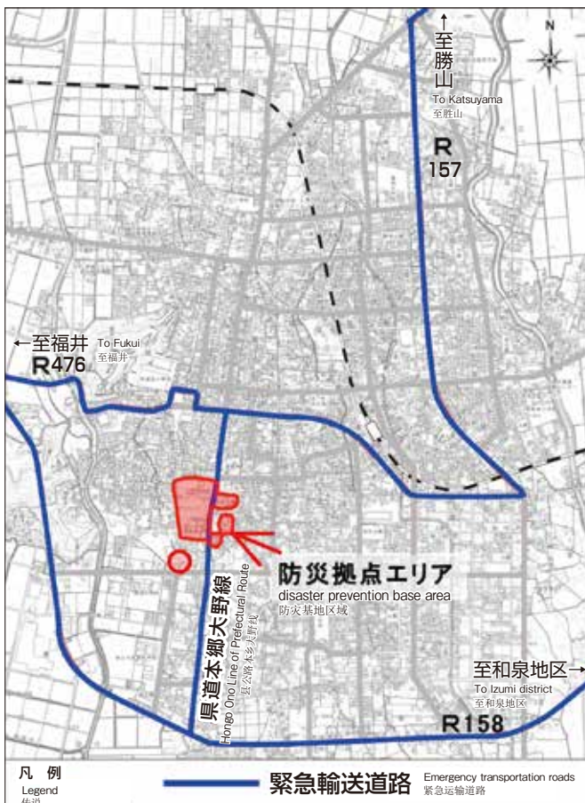
福井県緊急輸送道路ネットワーク図 Map of emergency transportation roads in Fukui Prefecture 福井县紧急交通网络图

县道本郷大野线，是国道 157，158 号，476 号等把灾害情报，道路管理基地并同形成了一个能够让主要命脉、生活物资的运送和，消火，救难的医疗基地全部联合起来的，主要应急基础网络。