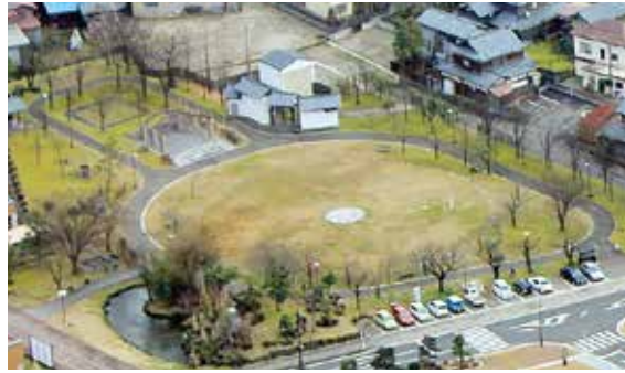
有終公園 Yushu park 有终公园

Let people feel safe and relieved by providing disaster prevention base area